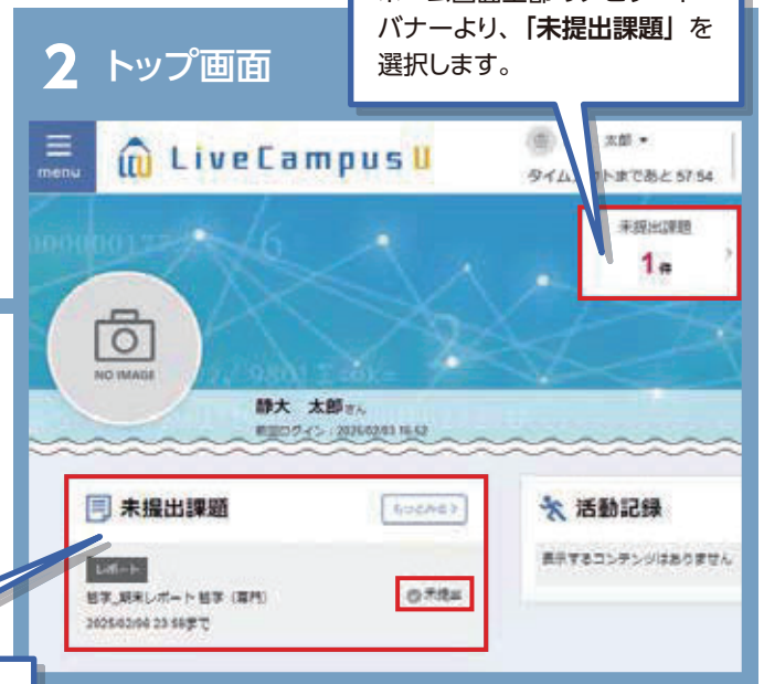
表示方法① ホーム画面上部のナビゲート バナーより、「未提出課題」を 選択します。