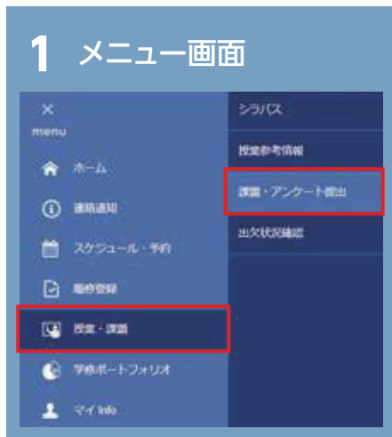
表示方法①② どちらかを選択

学務情報システムにログイン後、「menu→授業・課題→課題・アンケート提出」を選択 あるいは、ホーム画面上部に表示されるナビゲートバナー「未提出課題」 またはホーム画面下部「未提出課題」より、該当する課題の☑ ボタンをクリックして 「課題・アンケートリスト」を表示します。